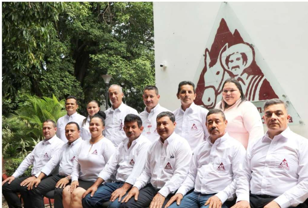
Comité Departamental de Cafeteros del Huila 2022 – 2026